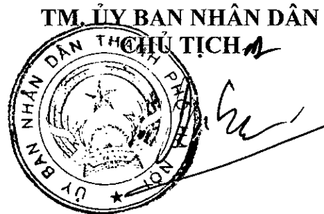
Chu Ngọc Anh